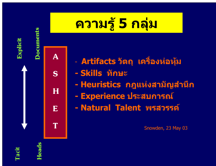
แผนภาพที่ 4

คุณสมบัติทั้ง 5 กลุ่มนี้ถือเป็นความรู้ทั้งสิ้น และจะต้องรู้จักนำมาใช้ประโยชน์ในกระบวนการจัดการความรู้ เมื่อนำอักษรตัวหน้าของคำทั้ง 5 มาเรียงกันเข้าจะได้เป็น ASHET หรือ ASHEN ความรู้กลุ่มที่อยู่ค่อนไปทางข้างบน จะมีลักษณะ “ชัดแจ้ง” (Explicit) มากกว่า สามารถหยิบฉวยมาใช้โดยตรงได้ง่ายกว่าส่วนกลุ่มที่อยู่ค่อนมาทางข้างล่าง จะมีลักษณะ “ฝังลึก” (tacit) มากกว่า แลกเปลี่ยนได้ยาก ยิ่งพรสวรรค์จะยิ่งแลกเปลี่ยนไม่ได้เลย จะสังเกตเห็นว่าในความรู้ 5 กลุ่มนี้ เป็นพรสวรรค์ 1 กลุ่ม และเป็นพรแสวง 4 กลุ่ม (โปรดดูแผนภาพที่ 4)